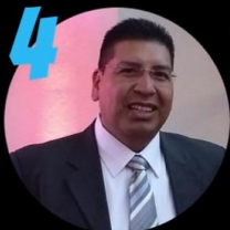
Luis A. Alonso S. L. P.